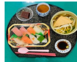
イベント食（いこいの日）の一例

管理栄養士が献立を考え、それぞれのご利用者様が食べやすい形態でお食事を提供します。